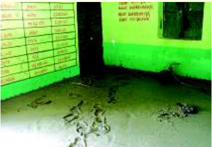
ಬಳ್ಳಾರಿ ಜಿಲ್ಲೆಯ ಶಿರಗುಪ್ಪದಲ್ಲಿ ನೆರೆಯಿಂದ ಹಾನಿಗೊಳಗಾದ ಸರ್ಕಾರಿ ಶಾಲೆಯೊಂದರ ಒಳಾಂಗಣ ನೋಟ ಒಂದು ವಾರದ ನಂತರ ಹೀಗೆ ಕಂಡು ಬಂತು.