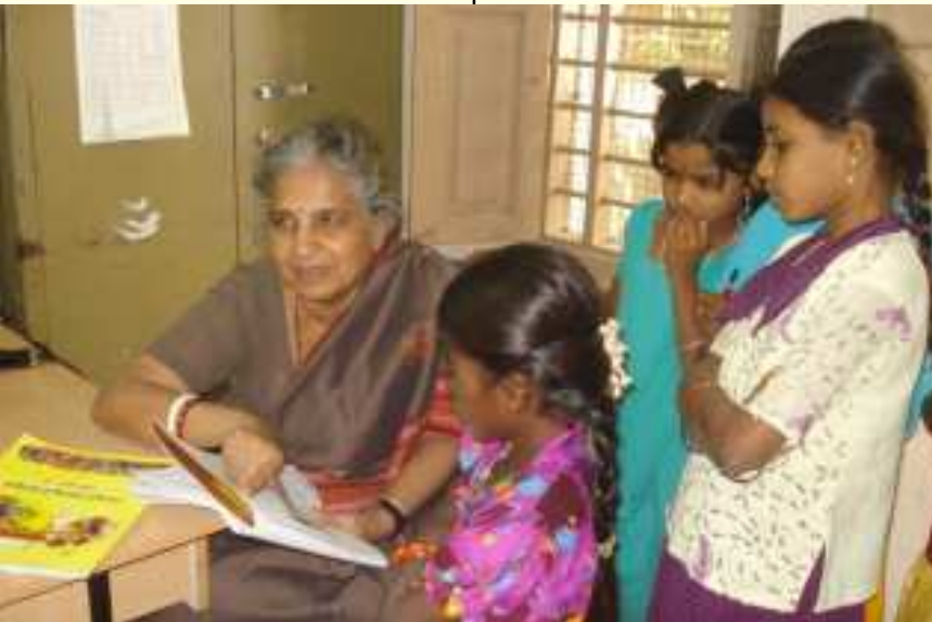
ಶ್ರೀಮತಿ ಸುಧಾಮೂರ್ತಿ ರಾಜಯಚೂರಿನಲ್ಲಿ 'ಪ್ರೇರಣ' ನಡೆಸುತ್ತಿರುವ ಸಂಪರ್ಕ ಶಾಲೆಯ ಮಕ್ಕಳೊಂದಿಗೆ ಮಾತನಾಡುತ್ತಿರುವುದು.

ಮಾನವ ಅಭಿವೃದ್ಧಿ ಸೂಚ್ಯಂಕಕ್ಕೆ ಸಂಬಂಧಪಟ್ಟಂತೆ ರಾಯಚೂರು ಜಿಲ್ಲೆ ರಾಜ್ಯದಲ್ಲಿ ಕೊನೆಯ ಸಾಲಿನಲ್ಲಿದೆ. ಅಭಿವೃದ್ಧಿಗಾಗಿ ದುಡಿಯುತ್ತಿರುವ ಸಂಸ್ಥೆಗಳು ಹಾಗೂ ವ್ಯಕ್ತಿಗಳಿಗೆ ಇಂತಹ ಸ್ಥಳದಲ್ಲಿ ಕೆಲಸ ಮಾಡುವುದೊಂದು ಸವಾಲಾಗಿದೆ. ಈ ನಿಟ್ಟಿನಲ್ಲಿ 'ಪ್ರೇರಣ' ಉತ್ತರ ಕರ್ನಾಟಕದಲ್ಲಿ ಉತ್ತಮವಾದ ಕೆಲಸವನ್ನು ಮಾಡಿ, ತನ್ನದೇ ಆದ ಛಾಪನ್ನು ಮೂಡಿಸುವಲ್ಲಿ ಯಶಸ್ವಿಯಾಗಿದೆ.