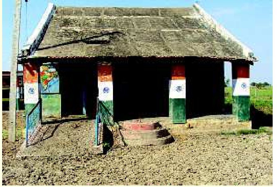
ನೆರೆ ಹಾವಳಿಯಿಂದಾಗಿ ನಲುಗಿರುವ ಬಳ್ಳಾರಿ ಜಿಲ್ಲೆಯ ಶಿರಗುಪ್ಪ ತಾಲೂಕಿನಲ್ಲಿರುವ ಸರ್ಕಾರಿ ಶಾಲೆಯ ಮುಂಭಾಗದ ಒಂದು ನೋಟ.

ತ್ರಿಚಿಗೇ ಉತ್ತರ ಕರ್ನಾಟಕದ ಕೆಲವು ಜಿಲ್ಲೆಗಳಲ್ಲಿ ನೆರೆ ಹಾವಳಿಯಿಂದ ಉಂಟಾದ ಹಾನಿ, ಎಂದಿಗೂ ಮರೆಯಲಾಗದಂತಹ ನೋವನ್ನು ಸಾವಿರಾರು ಜನರಲ್ಲಿ ತಂದಿದೆ. ಅನಾವೃಷ್ಟಿಯಿಂದ ಪರಿತಪಿಸುತ್ತಿದ್ದ ಉತ್ತರ ಕರ್ನಾಟಕದಂತಹ ಭಾಗದಲ್ಲಿ ಈ ಅತಿವೃಷ್ಟಿಯಿಂದ ಆದ ನೆರೆ ನಿಜಕ್ಕೂ ಭಾರಿ ಅನಾಹುತವನ್ನೇ ಉಂಟು ಮಾಡಿತು. ಒಂದೆಡೆ ನೂರಾರು ಜನರು ಪ್ರಾಣ ತೆತ್ತರೆ, ಸಹಸ್ರಾರು ಜನರು ಮನೆ, ಆಸ್ತಿ ಮತ್ತು ಜಮೀನುಗಳನ್ನು ಕಳೆದುಕೊಂಡು ಇನ್ನೂ ಅತಂತ್ರ ಸ್ಥಿತಿ ಎದುರಿಸುತ್ತಿದ್ದಾರೆ. ಈ ಭಾಗದ ಜನರು ಎದುರಿಸುತ್ತಿರುವಂತಹ ಸಾವು ನೋವುಗಳನ್ನು ವಾಧ್ಯವ್ಯವಸ್ಥೆಗಳು ಬಿಂಬಿಸಿದವು. ಆದರೆ, ನೆರೆಯಿಂದಾಗಿ ಮಕ್ಕಳಿಗೆ ಉಂಟಾದ ಪರಿಸ್ಥಿತಿ ಅಷ್ಟಾಗಿ ಗಮನಕ್ಕೆ ಬರಲಿಲ್ಲ. ಅಂದಾಜಿನ ಪ್ರಕಾರ 275,000 (source: headlinesindia.com, Oct. 9, 2009)